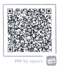
PAY by square

V prípade dodania služby do iného členského štátu EU: Prenesenie daňovej povinnosti (podľa §74 zákona 222/2004 Z.z.). V prípade dodania tovaru do iného členského štátu EU: Dodanie je oslobodené od dane (podľa §74 zákona 222/2004 Z.z.).