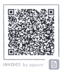
INVOICE by square